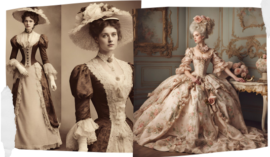
Imagen 3. Moda rococó y estilo victoriano