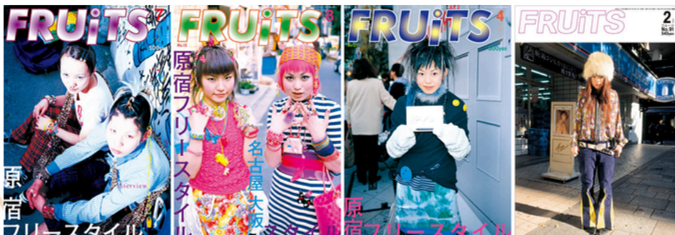
Imagen 4. Revista Fruits