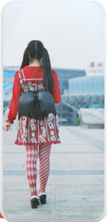
Imagen 1. Moda lolita

Este barrio tiene mucha concurrencia gracias al comercio, parques, templos y universidades que alberga; sin embargo, es conocido por ser uno de los distritos de modas más influyentes a nivel mundial. Las