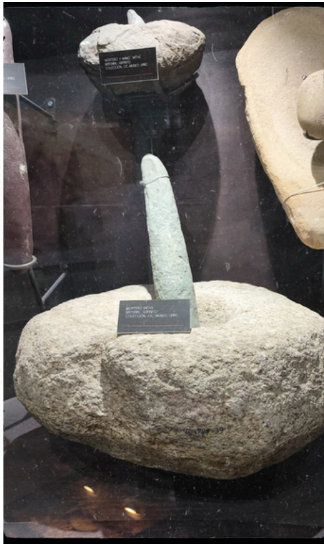
Imagen 2. Mortero de granito exhibido en el IIC-Museo UABC