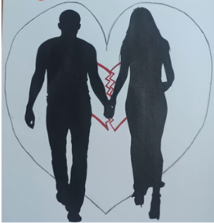
Imagen 3. Violencia con amor