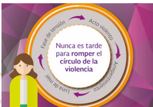
Imagen 3. Círculo de la Violencia