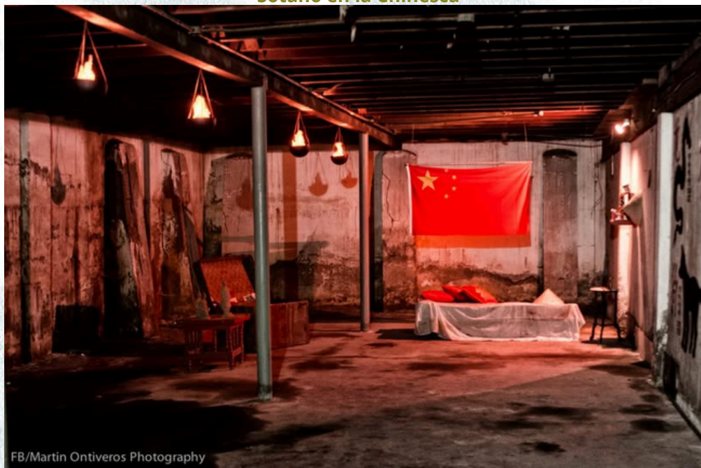
Sótano en la Chinesca

Así, el problema de exponer a una figura que por su monumentalidad intenta presentarse como un símbolo y colocarla en un barrio con esas características, encubre también lo complejo que suele ser el estar en ciudades a donde arriban una variedad amplia de personas provenientes de distintos lugares del mundo y de México. Tener un colosal cocinero chino es elegir un grupo migratorio específico como ejemplo representativo en una ciudad multicultural, esa selección no se realiza de manera inocente, ya que tiene como implicación distinguir quiénes merecen ser reconocidas y reconocidos y quiénes continúan en el ocultamiento. Finalmente agregaría, que se minimiza la resistencia con lo que han podido sobrevivir las y los pobladores con origen chino, por preservar el estereotipo y la comercialización de su imagen.